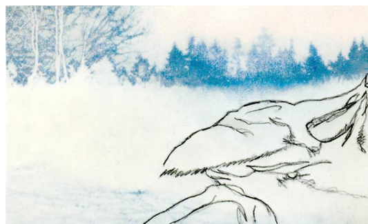
Anamèse 2 de Juliette Fontaine